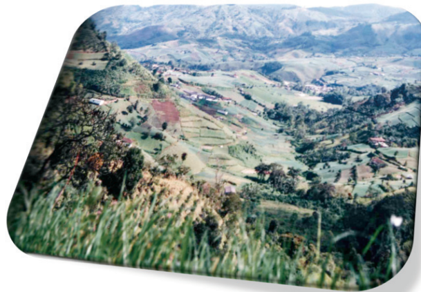
Imagen N°2: Vista panorámica del corregimiento de la Florida. En esta imagen se pretende evidenciar el potencial ambiental y paisajístico del territorio rural del municipio de Pereira y del departamento de Risaralda, en el se deben fortalecer proyectos encaminados al mejoramiento de las condiciones de vida de sus habitantes, encontrado en el lugar las condiciones ideales para habitar de una manera sostenible y sustentable.