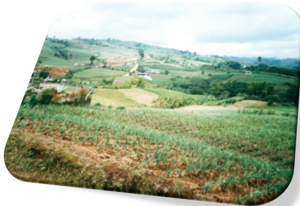
Imagen N°3: Fotografía aérea. Panorámica de la zona de cultivos de la Bella. El impacto económico y cultural de la Bella en términos de cobertura del suelo es importante para le municipio y el departamento; es de vital importancia que la planeación estratégica en esta zona permita consolidar la vocación del suelo mejorando los procesos de control y seguimiento de la producción tendientes a disminuir el impacto natural del territorio.