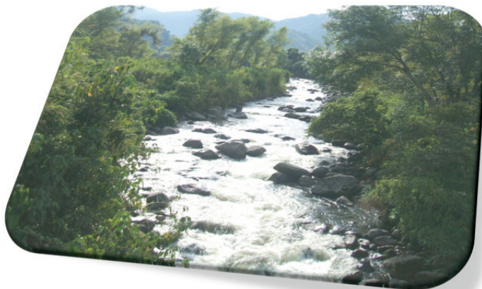
Imagen N°4: Panorámica del Río Otún. La conservación, preservación de los sistemas ambientales del territorio garantizan la sustentabilidad del territorio; una mirada a las condiciones ambientales de la zona de influencia del Río Otún permiten evidenciar el gran potencial ecológico presente en la región, el Ordenamiento de sus cuencas debe ser el pilar fundamental de la proyección a futuro del desarrollo sustentable del municipio, la región y el país.