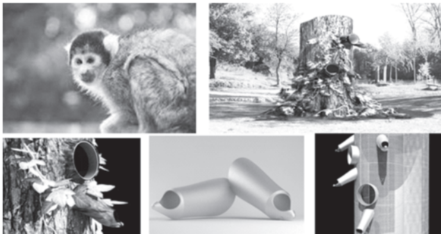
Figura 1 - Comedero y apariencia general del hábitat semi-natural

El comedero maneja la analogía formal de las extremidades del árbol y el nicho la analogía de grieta entre las ramas del árbol. De esta manera proporcionarle el alimento y el agua de la forma más natural posible simulando las condiciones por las cuales obtendría el alimento en su ecosistema natural (Figura 1)