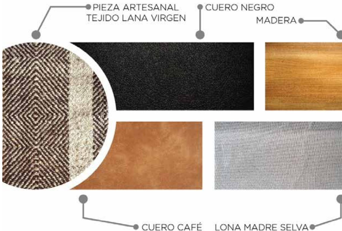
Figura 2. Materiales para el zapato casual

Por último, la línea de calzado deportiva se caracteriza por las diferentes influencias de los deportes y las multitareas que debe cumplir. Se relaciona con la cultura Nariño, una comunidad que durante su periodo de desarrollo tuvo mucha influencia de los pueblos aledaños del sur, mejorando sus habilidades en el campo de la agricultura, labor que debían realizar con gran destreza y cuidado, teniendo en cuenta el terreno montañoso en el que se encontraban ubicado.