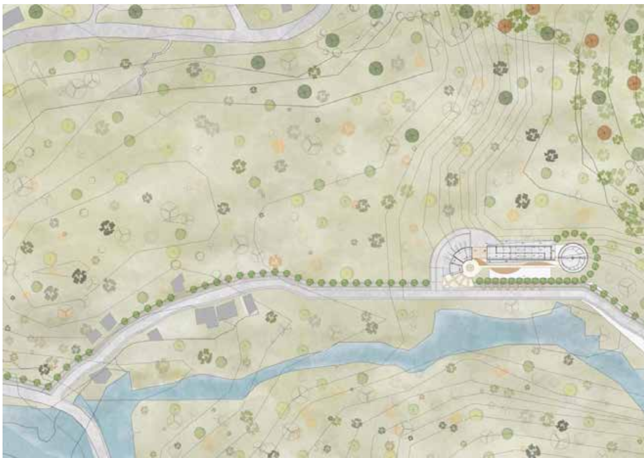
Ilustración 2. Emplazamiento y vista del proyecto