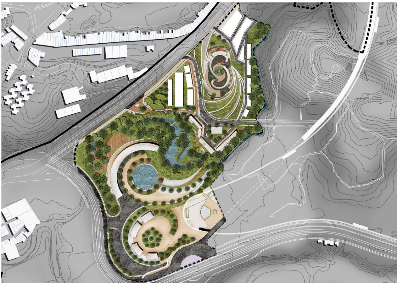
Figura 2. Implantación del proyecto urbano integral