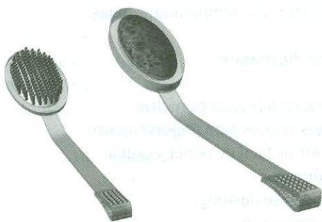
Figura 1: Renderizados de la ayuda técnica

Como aspectos a mejorar del diseño se vio que el material que en este caso fue el acrílico resultaba quebradizo por lo tanto es importante para futuros avances trabajar con otro tipo de polímero. También por lo limitado del tiempo para el desarrollo de este tipo de proyectos se pudieron haber quedado excluidos ciertos cubiertos se presentan las imágenes del producto final tanto en la proyección digital como el prototipo final. (Figuras 1,2y3).