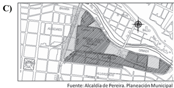
Figura 4. Delimitación Plan Parcial Proyecto de Renovación Urbana "Bavaria" Pereira. Decreto 293 de 2003, decreto 190 de 2008. (Alcaldía de Pereira. Planeación Municipal).

En los últimos 10 años Pereira ha sufrido un proceso de transformación muy significativo, modificando y regenerando significativamente el suelo urbano, conservando los valores y las características morfológicas del territorio intervenido, entre ellas las características generales del tejido urbano y los edificios de patrimonio bien inmueble reconocidos en el POT.