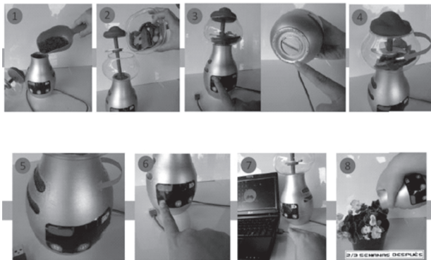
Figura 2. Secuencia de usabilidad e COMPO 022

La tecnología que se utiliza en el objeto es simple, pero acorde con el contexto. Funciona con una batería de ion de litio que permite usar el elemento sin estar conectado a la energía; pero al momento de descargarse se conecta a un computador o a otro aparato tecnológico con puerto USB. Se ubica en la parte frontal una pantalla táctil (Figura 3), que tiene: