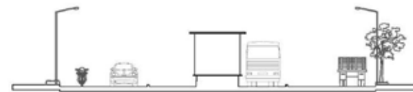
Av. 30 de agosto -- Calle 34