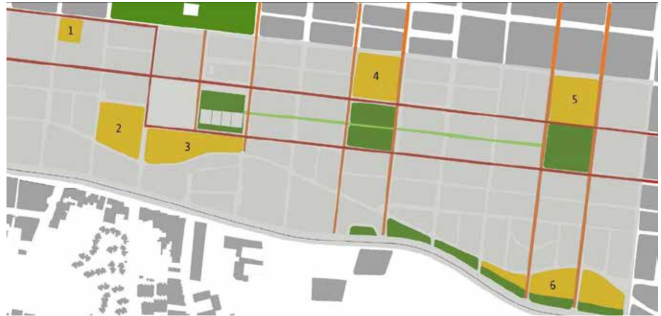
1. Bazar popular 2. Liga de gimnasia 3. Centro de reciclaje 4. Jardín infantil 5. Biblioteca 6. Talleres automotrices

se pretende también equilibrar la zona en cuanto a la concentración de servicios y equipamientos y darle respuesta al déficit de espacio público.