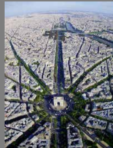
Place Charles De Gaulle

Los espacios públicos deben estar conectados de tal forma que se articulen unos con otros como una red, Esta red es el componente del espacio urbano que permite la parcelación, al proporcionar acceso, permite la circulación entre los distintos sectores de la ciudad, la comunicación entre los ciudadanos y la percepción del espacio urbano por parte de sus habitantes.