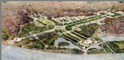
Plan de Washington