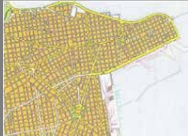
Plano Ortogonal (Montevideo, Uruguay)