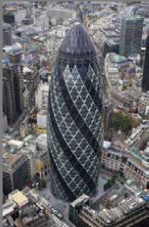
Torre Suiza Londres