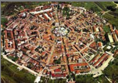
Plano Radio céntrico (Moscú, Rusia)

Actualmente en las diferentes ciudades se pueden identificar varios tipos de morfología urbana, según la zona de la ciudad, dependiendo de la época de construcción y de la función que predomina en ellas. Los tipos son: