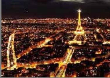
Torre Eiffel Paris