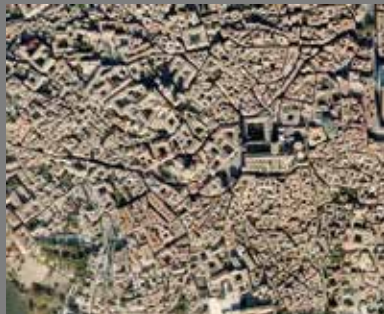
Plano Irregular (Toledo)