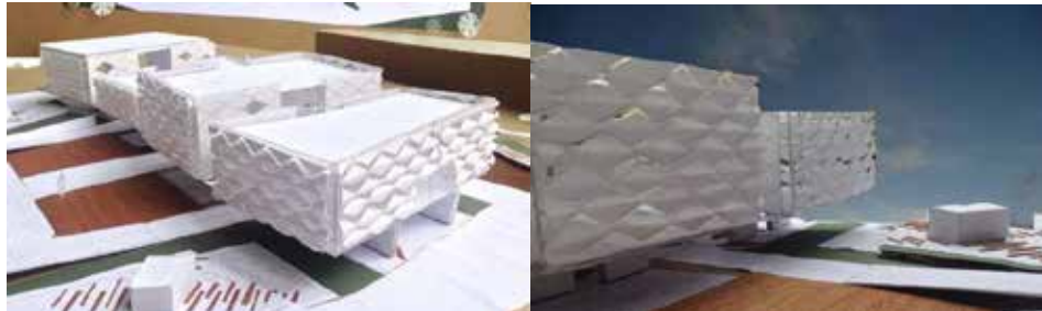
3. Museo interactivo de historia