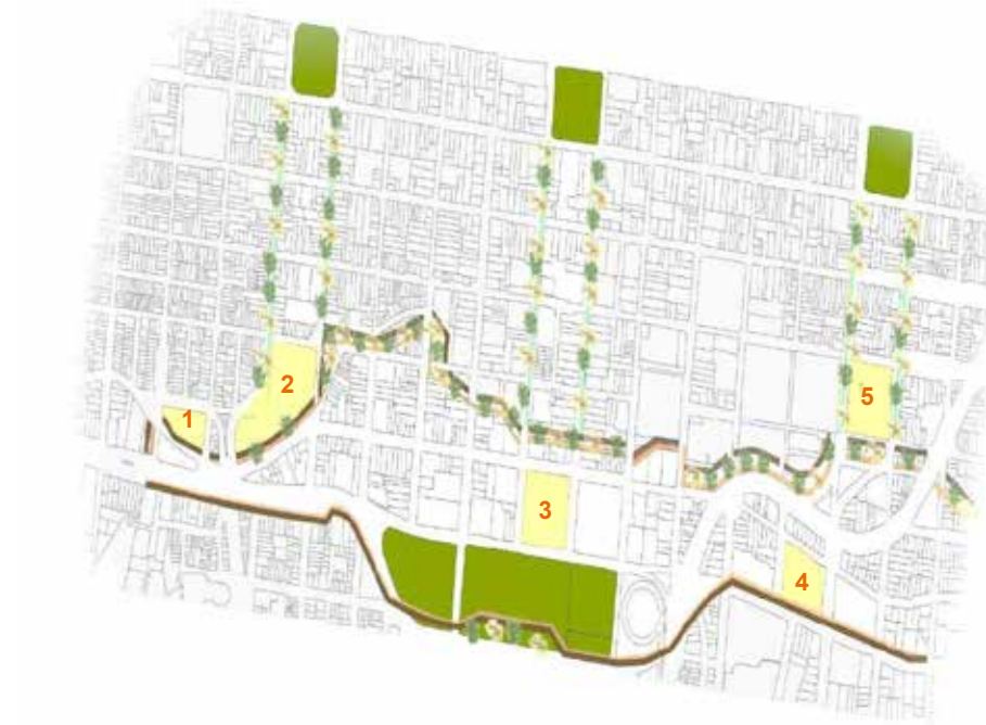
3. Museo interactivo de historia