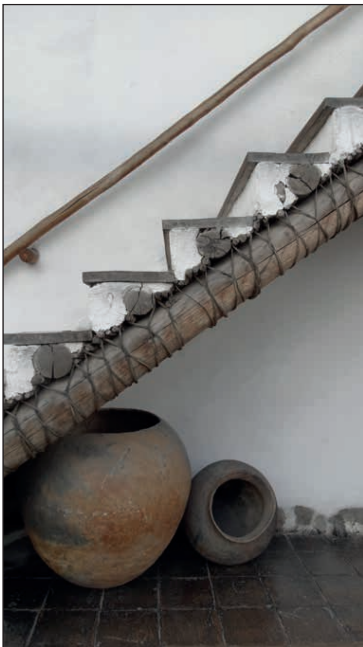
La escalera y la tinaja - Pasto

Propuesta de caracterización del desarrollo humano y su impacto desde la formación profesional: caso de los funcionarios en carrera administrativa de la alcaldía de Tuluá (Valle del Cauca), 2014