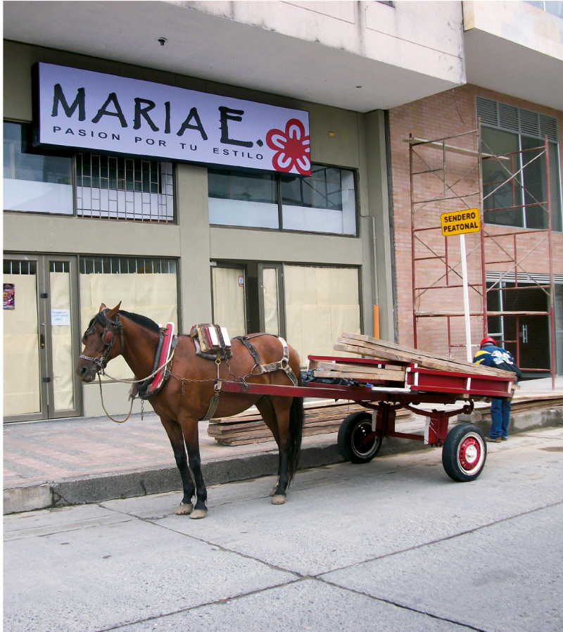
Centro calle 23 - Pereira