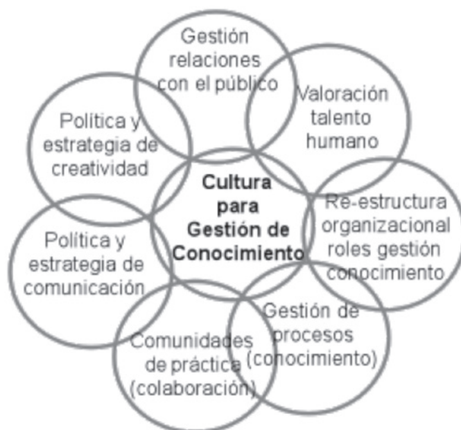
Figura 4. Cultura para la gestión de conocimiento

La cultura organizacional incluye todo tipo de valores, tradiciones, rituales, estándares y comportamientos que determinan cómo actúan las personas en las organizaciones; el reto es desarrollar una cultura organizacional que acelere y active los procesos de gestión de conocimiento en la organización. Para ello se requiere de una estrategia de orientación, buenas prácticas y un sistema de evaluación de la efectividad y eficiencia alcanzada.