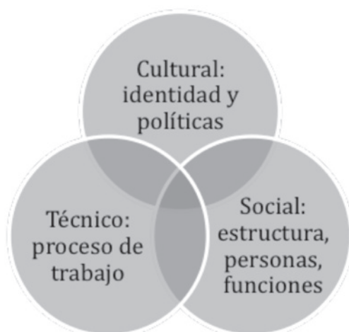
Figura 3. Subsistemas de la organización

Los procesos de trabajo que realizan las personas en las organizaciones están vinculados con las funciones, con las estructuras, con los procesos, pero también con la identidad y las políticas, además de la tecnología, la investigación, el desarrollo y la innovación.