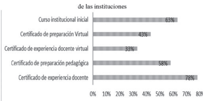
Figura II Exigencia de experiencia y capacitación para los docentes virtuales por parte de las instituciones

Se puede analizar el seguimiento institucional a los docentes desde dos aspectos: el primero lo que acontece antes de iniciar su labor y que corresponde a las exigencias que tienen las instituciones de educación superior para su ingreso como docentes virtuales, en éstas aparecen aspectos como la experiencia y la capacitación principalmente, que se muestran en la figura II.