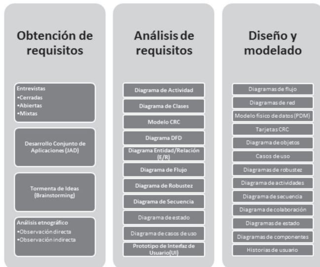
Fig. 3. Técnicas y artefactos de am [23].

proveedor será asegurar el flujo constante de producto según esta prioridad. Además, parte del conjunto de requisitos no abordados, por tener menor prioridad y no estar en el alcance de la iteración, a menudo acaban considerándose innecesarios. El producto obtenido con este enfoque es más acorde a la filosofía “Lean” [24].