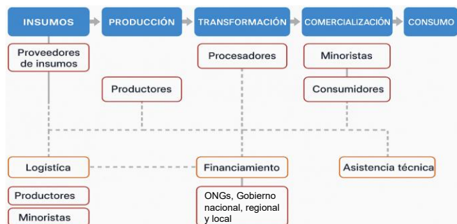
Fig. 2. Esquema general de una cadena productiva agroalimentaria integrada de Yuca [13].

En el contexto del departamento del Chocó, la cadena de la yuca presenta características particulares: predominan sistemas de producción campesinos, étnicos y familiares, con baja mecanización, limitada agregación de valor y un acceso restringido a mercados formales [7], [21]. Sin embargo, estas condiciones también permiten identificar oportunidades estratégicas para fortalecer la cadena mediante esquemas asociativos, apoyo institucional y mejora en los servicios de extensión rural [49].