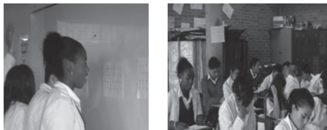
Fig. 3. Estudiantes realizando el ejercicio de gimnasia cerebral y la lectura de la guía de trabajo en la sesión tres.

Sesión dos: para la segunda sesión se trabajó con una población de 23 estudiantes, que realizaron un ejercicio de gimnasia cerebral al iniciar la clase, como lo hicieron en las sesiones consecutivas para fijar la atención. Este ejercicio permitió fomentar un ambiente de disposición positiva frente a las sesiones lo que permitió aclarar pre-conceptos y comprender los nuevos conocimientos sobre el equilibrio químico. El ejercicio realizado fue el planteado en el ítem C, que dio como resultado un mejor estado de concentración. En la Fig. 3 se puede observar el ambiente de aula. Se logró que la lectura de la guía se hiciera muy detenidamente y se fijó la atención en el desarrollo de la práctica.