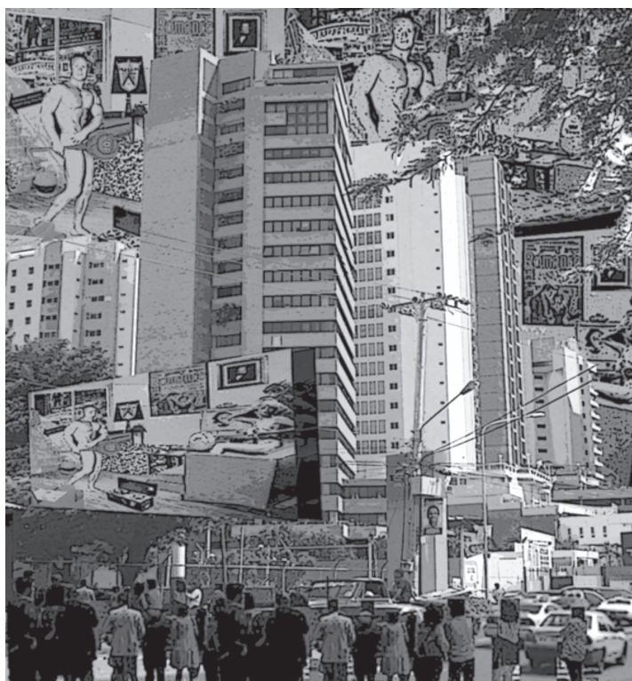
Imagen 2. Modelo de ciudad globalizada y capitalista.

Dentro de este marco comenzó la “ciudad colonial”; por muchos años se ha creído que sus orígenes se remontan a la conquista hispana, pero para ese momento ya existían las civilizaciones precolombinas (aztecas, mayas, incas), las cuales dejaron un amplio legado en la historia, por contar con extensos conocimientos en la