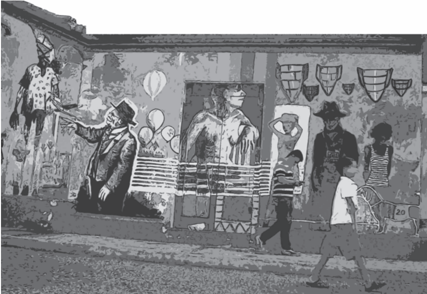
Imagen 1. Patrimonio simbólico de los barrios.

Por otra parte, los debates que han emergido como nueva realidad en los dos últimos siglos con la intensificación y aceleración son las periferias vulnerables latinoamericana, que se han convertido en los fantasmas que atemorizan a las grandes ciudades.