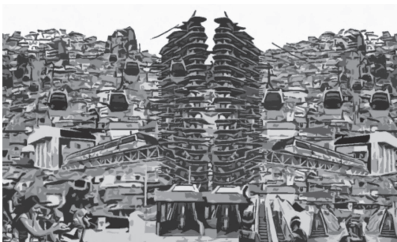
Imagen 4. Modelo de periferia vertical.

La integración de los espacios públicos verticales, con las edificaciones institucionales, transporte público, mobiliario urbano que mejore el paisaje; todos estos elementos deben funcionar como red consolidada en