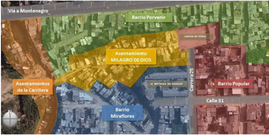
Figura 1. Localización del asentamiento (SIG Quindío)

es posible acceder a él por cualquiera de estos sectores (Figura 1).