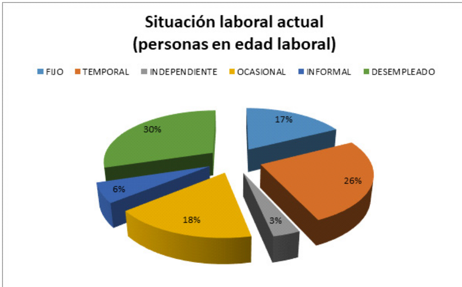
Figura 3. Situación laboral de los habitantes del asentamiento Milagro de Dios que se encuentran en edad de trabajar

en un reto para las políticas sociales establecidas por las instituciones públicas. La edad promedio de los habitantes del asentamiento es de 26 años; es una potencialidad a la hora de establecer iniciativas de formación y productividad. La población del asentamiento informal está conformada por mestizos (60%) y afrodescendientes (40%) (Castañeda-Pérez y Mejía Lotero, 2017) que, por su significativo porcentaje, convierte a El Milagro de Dios en el lugar de mayor concentración de población afrodescendiente del departamento del Quindío, para quienes existen políticas y programas específicos del orden local y nacional dirigidos a la ejecución de actividades para mejorar sus condiciones de vida bajo el denominado enfoque diferencial.