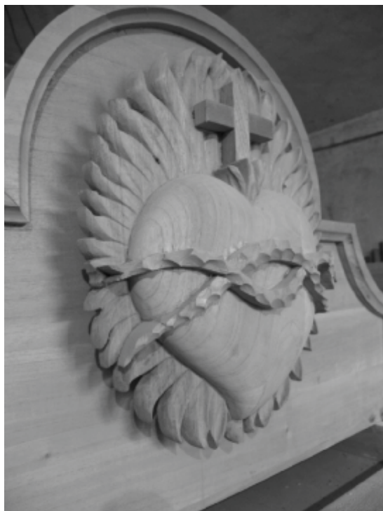
Foto 3. Detalle de mesa.

Los referentes cambian según el contexto y el deseo de representación; sin embargo, la talla permanece como una expresión que da vida a las narraciones por medio de figuras populares, exponiendo “formas lingüísticas”. En este caso, se transmite por medio de la representación la dinámica de la memoria colectiva, circulando el mensaje dentro de la esfera espacio temporal; el medio físico es la madera y el medio comunicacional es la talla, con lo cual se escribe, se deja la huella, se expresan significantes formales sustentados en “significados culturales”.