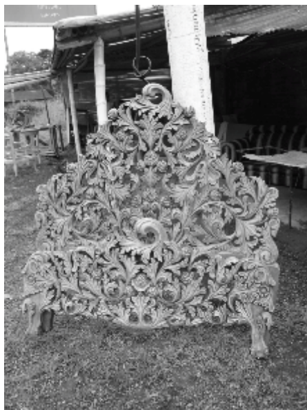
Foto 9. Cabecero de cama.