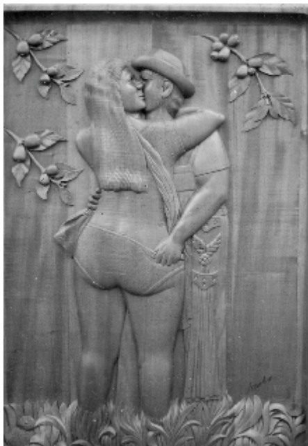
Foto 7. Pareja Campesina