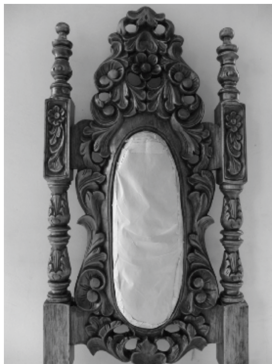
Foto 10. Detalle silla