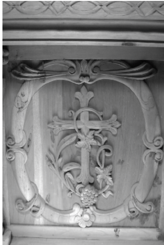
Foto 2. Detalle de mesa.

En lo religioso se encuentra una gran iconografía que no sólo evoca cosas ausentes, sino también series de sucesos relacionados unos con otros; lo simbólico como una forma de expresión antigua ha revelado aspectos de la realidad trascendiendo el tiempo y el espacio, dejando ver la esencia de lo que se quiere describir, participando de la realidad contextual.